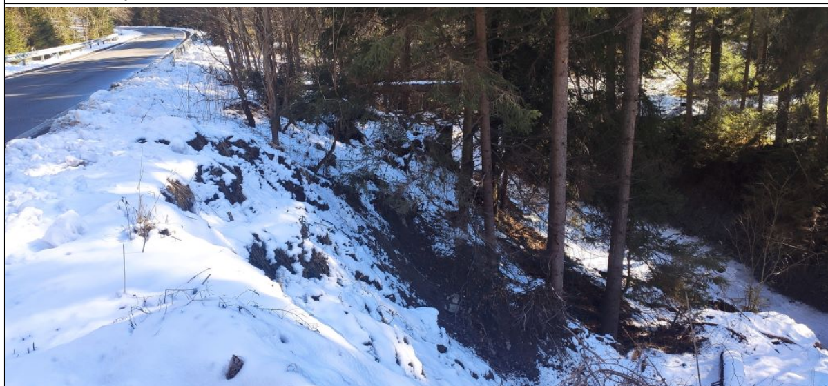
Wschodni fragment skarpy głównej