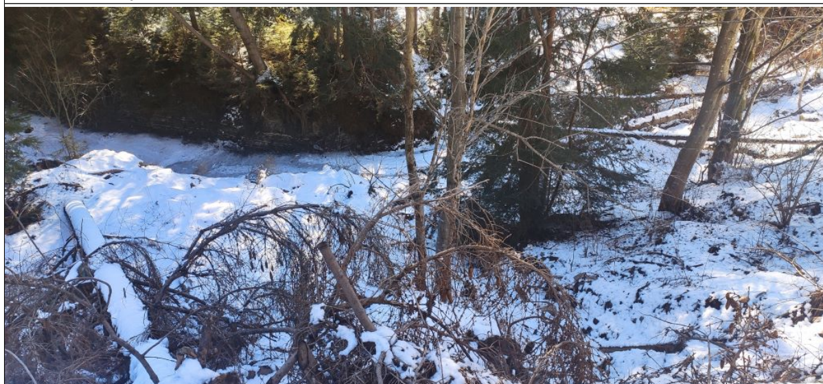
Centralna część osuwiska