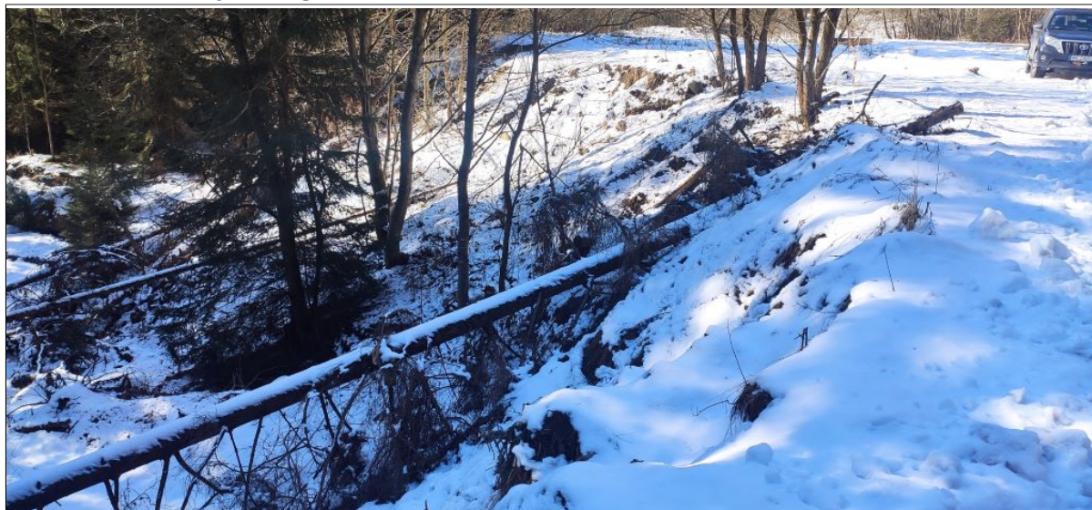
Zachodnia część osuwiska