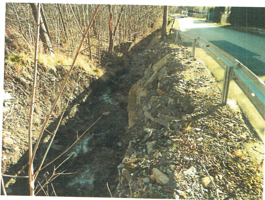
Wzmocniona kamieniami skarpa przykorytowa