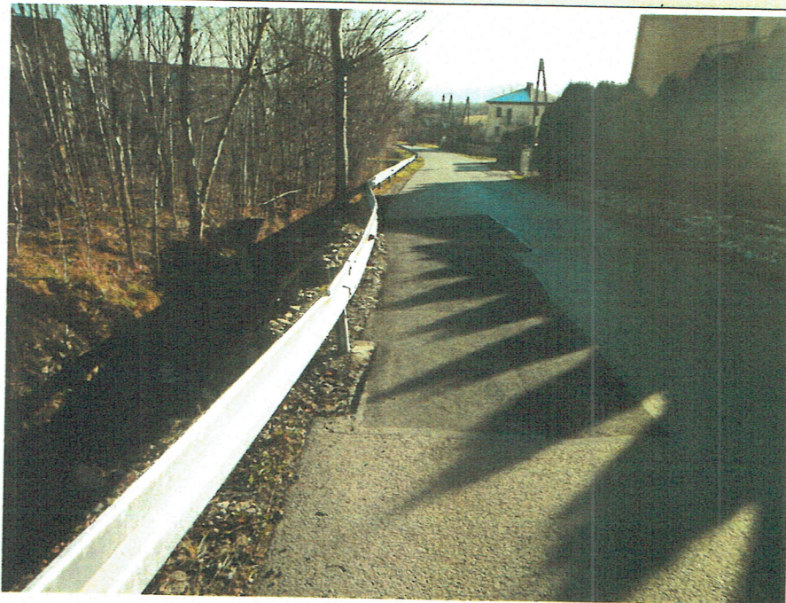
Widok na naprawioną jezdnię