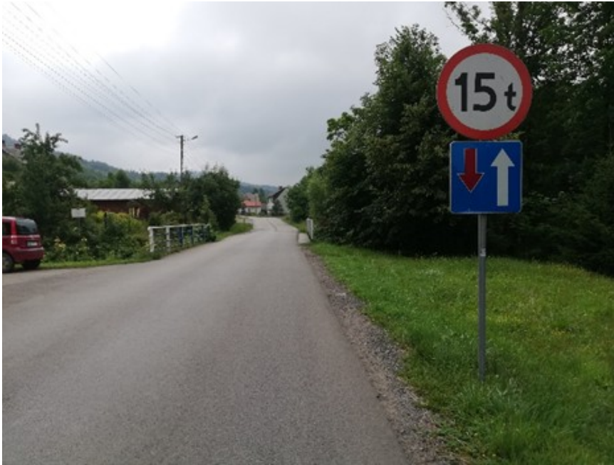
Ilustracja 2: Obiekt mostowy w ciągu DP 1425S w km 7+391 w Juszczyńce - stan istniejący, widok ogólny