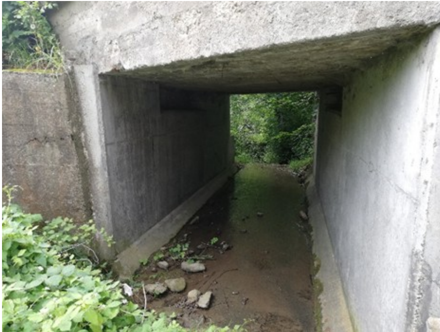
Ilustracja 1: Obiekt mostowy w ciągu DP 1425S w km 7+391 w Juszczyźnie - stan istniejący

Wykonanie opracowania projektowego dla zadania: Przebudowa obiektu mostowego w ciągu drogi powiatowej 1425S Wieprz – Juszczyzna – Jeleśnia w km 7+391 w Juszczyźnie