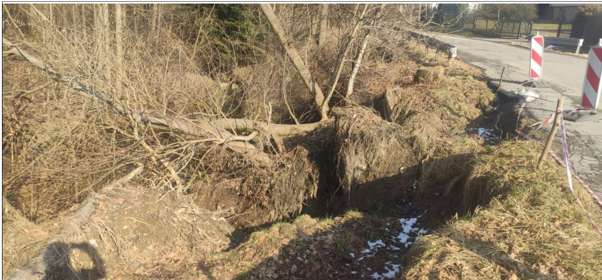
Zniszczona skarpa i korpus drogi pow. wschodnia część osuwiska