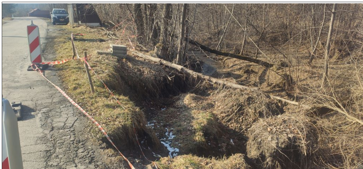
Uszkodzenia jezdni i korpusu w zachodniej części osuwiska